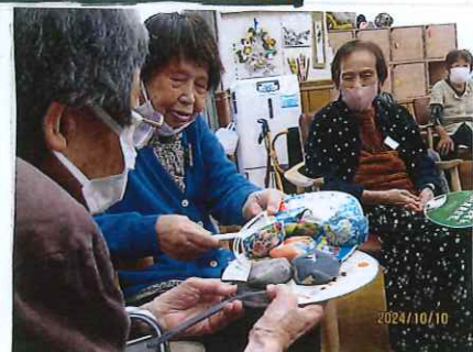
うちわでお串玉リレー

★ ありがとうございます！ ーデイサービスからー キコえてくる笑い声からー 私たちはいつも元気を いただいています。風邪を ひかないよう、お気を つけて。ー看護師より