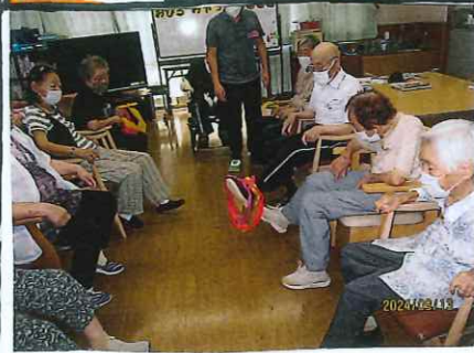
足で🚲輪っかリレー