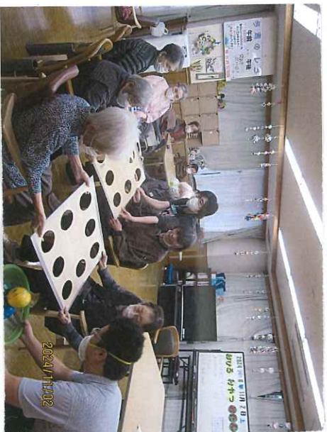
穴に落ちないようにな...