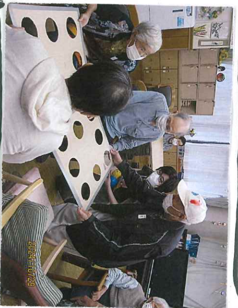
皆で協力し合ってせーの!!