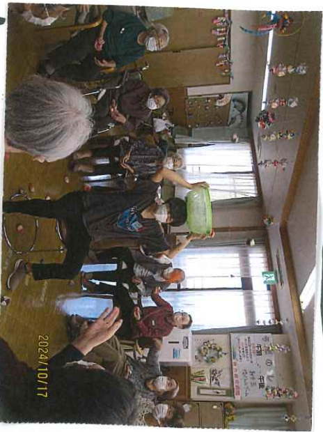
今度は腕を振り上げで!!