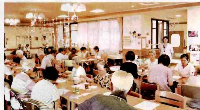
[H29年7月10日第1回催日の様子]

地域の皆さんや、皆さんを支える方々で集まり、お茶を飲みながらおしゃべりや、音楽鑑賞等楽しいひと時を過ごしませんか。ほんの少し知り合いが増えたり、認知症や介護予防の知識を得て頂ける地域の皆様どなたでも参加可能な居場所です。お誘いあわせの上、是非お越しください。