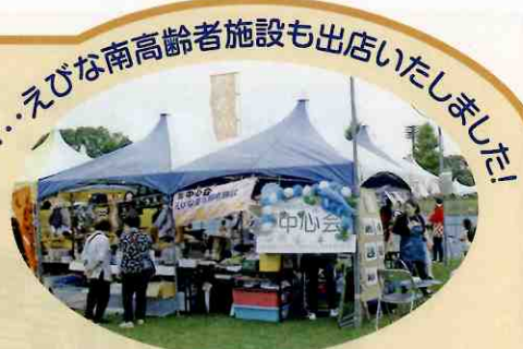
えびな南高齢者施設も出店いたしました!

参加したご利用者も達成感を感じてもらうことが出来、夏の思い出になっ たと思います。